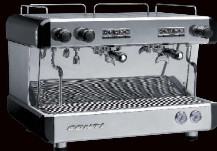
CC100 Tall Cup