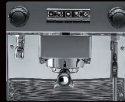
1 et 2