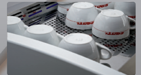
Chauffe tasses de grande capacité avec arrêts tasses High capacity of the cup warmer with stopping edges