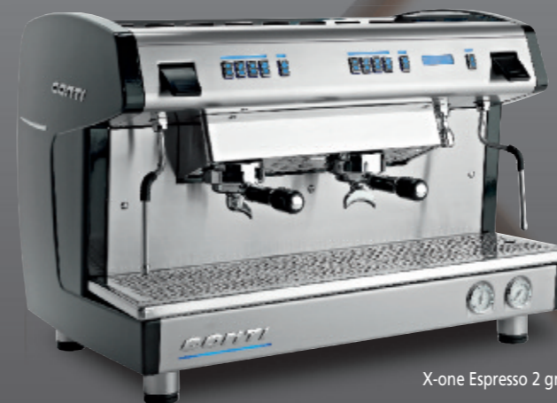
X-one Espresso 2 groupes