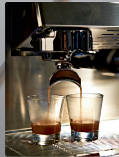
Espresso (E), hauteur sous bec = 83 mm Espresso (E), spout height = 83 mm