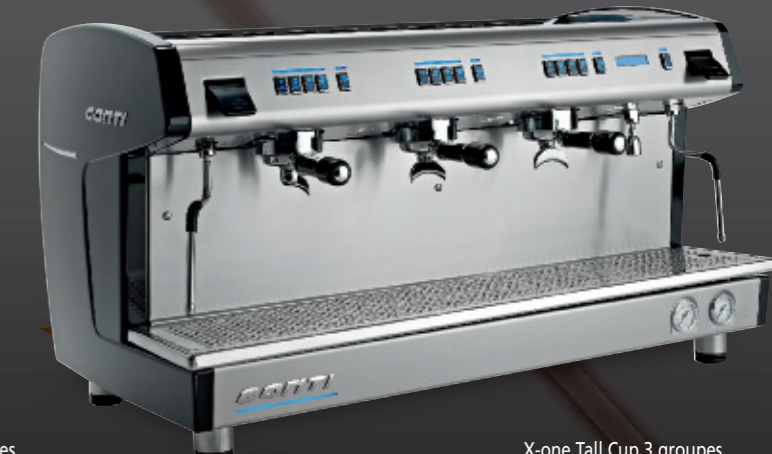
X-one Tall Cup 3 groupes