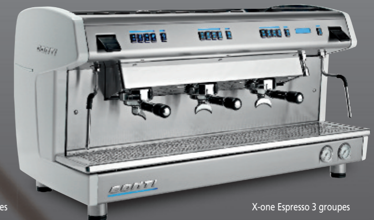
X-one Espresso 3 groupes