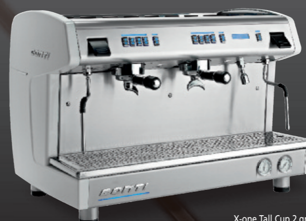
X-one Tall Cup 2 groupes