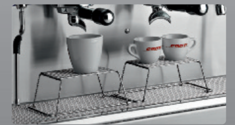
Rehausseurs de tasses pour version Tall Cup Wire stands for Tall Cup version