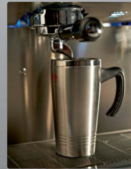
Tall Cup (TC) pour gobelets et « Take Away », hauteur sous bec = 160 mm Tall cup (TC) for high cups and take away Spout height = 160 mm